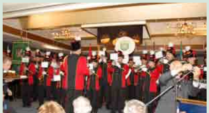
Schutterij EMM brengt een serenade aan St. Andries die haar 65 jarig jubileum vierde.