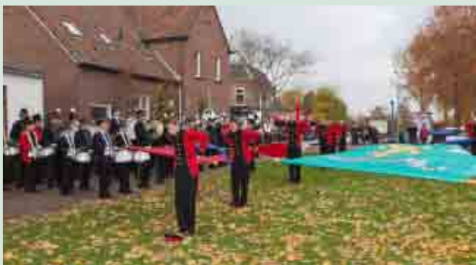
Samen met KDO en St. Andries brengt Schutterij EMM een serenade en vendelhulde aan carnavalsvereniging De Deurdreiers die haar 55 jarig jubileum vierde.